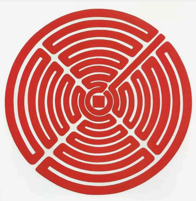
Sieglinde Bölz, Vom weißen zum roten Quadrat , 1990, Acryl auf Baumwolle, 150 x 150 cm

Das verbindende Element der Malerei von Sieglinde Bölz und Beate Knapp sind die intensive Farbigkeit und die Leuchtkraft, welche die Arbeiten prägen. Die den beiden Künstlerinnen jeweils eigene gestische Malfaktur ist dabei in einer Jahrzehnte währenden konsequenten Entwicklung selbstständig gebundener Bildsysteme vorangeschritten, hin zu einem eher ungegenständlich informellen Ausdrucksgehalt. Stand zu Beginn der 1980er Jahre die Figuration noch im Mittelpunkt des Interesses, lösten sich beide Malerinnen rasch von der eigentlichen Darstellung des menschlichen Körpers, bewahrten aber dennoch zugleich beharrlich den Menschen als Bezugspunkt ihrer Arbeit. Grundkonstellationen individueller Existenz und menschlichen Handelns erscheinen nun in Form von Bewegungsspuren in Abwesenheit ihrer Urheber. Bald tauchen sie als unmittelbare malerische Indizien in Gestalt der vom Menschen in alltäglichem Gebrauch verwendeten Dinge auf, bald zeichenhaft übertragen in geistig-philosophische Raumpläne allgemeingültiger geometrischer oder ornamentaler Chiffren, immer aber auf dem jeweils eigenen Weg in die Farbe.