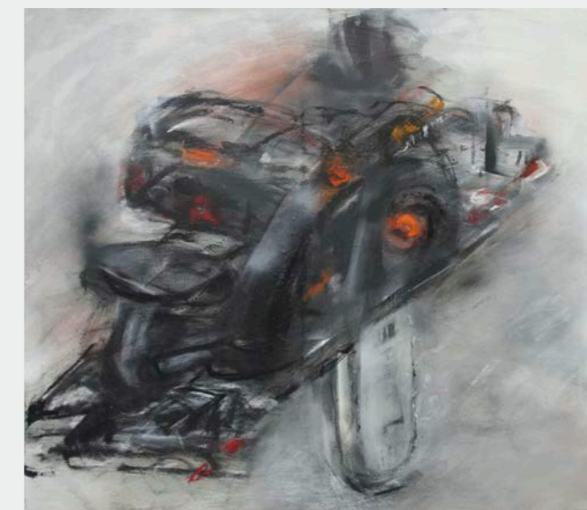
Beate Knapp, Säge , 2009, Mischtechnik auf Leinwand, 105 x 120 cm