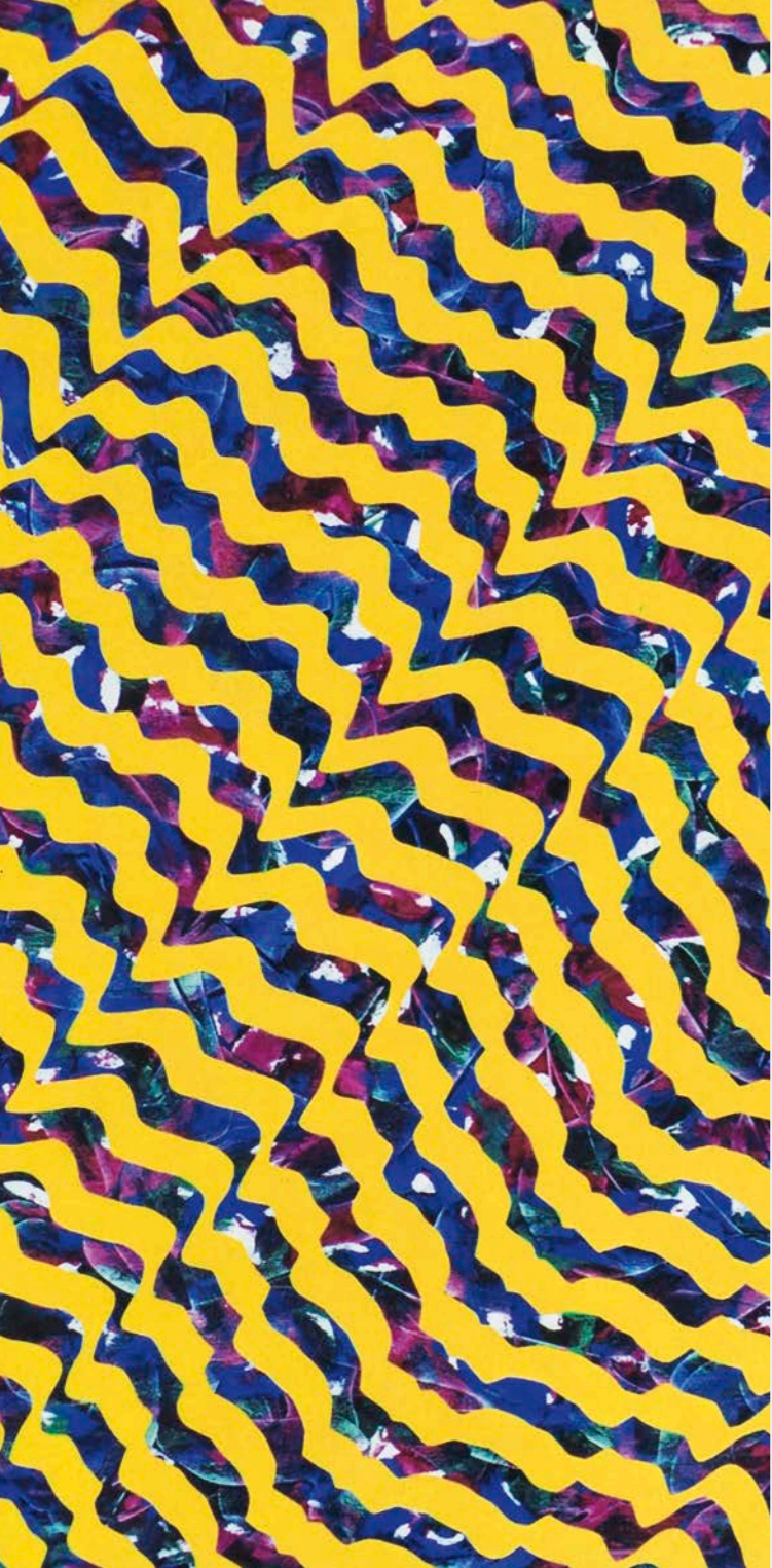
Sieglinde Bölz, Anamorphose von Raum und Zeit, 2014 (Detail), Acryl auf Baumwolle, 110x75 cm